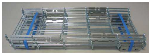
1) Réceptionner le colis