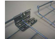
5) Installer une éclisse sur la 1ère longueur