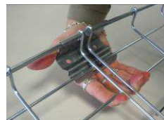
7) Et clipser !!!