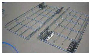
3) Prendre les deux 1ère longueurs pré-éclissées à assembler