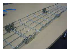
11) Répéter l'opération autant de fois que nécessaire, selon le nombre de longueurs à assembler