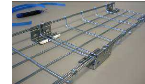
10) Les deux 1ère longueurs sont assemblées