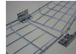
4) Présenter les chemins de câbles bout à bout, et enlever les éclisses de la 1ère longueur, pour les mettre en place