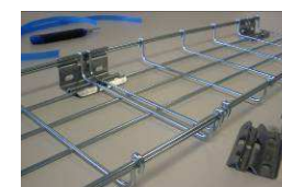
9) Procéder de même pour installer la 2ème éclisse