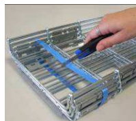
2) Couper les liens et déballer le colis