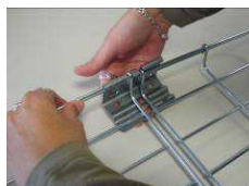
6) Positionner la 2ème longueur