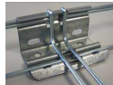
8) La 1ère éclisse est en place